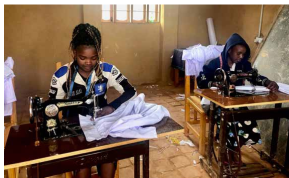
Schuluniformen werden in den Nähschulen hergestellt

www.eineweltgruppe.at Spendenkonto: ATO3 3745 8000 0243 4793